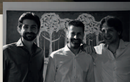
IL TEAM DI LAVORO +studi //

Il caratteristico corridoio che accoglie le opere pittoriche, distribuisce gli accessi agli spazi privati delle camere e dei bagni e, al contempo, offre una visione interna di suggestivo interesse lasciando entrare i raggi del sole che si riflettono sulla superficie d'acqua esterna, alla ricerca di quel rapporto interno-esterno che caratterizza la villa stessa.